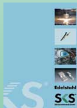
SKS Edelstahl Nr. 5-01000-008-2008