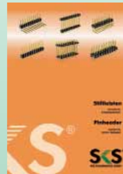
SKS Stiflleisten Nr. 5-01000-008-2008