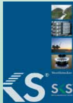
SKS Ventilstecker Nr. 5-01000-001-2010

Look and see for yourself our variety of performance. Request our brochures!