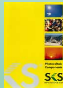
SKS Photovoltaik Nr. 5-01000-001-2011